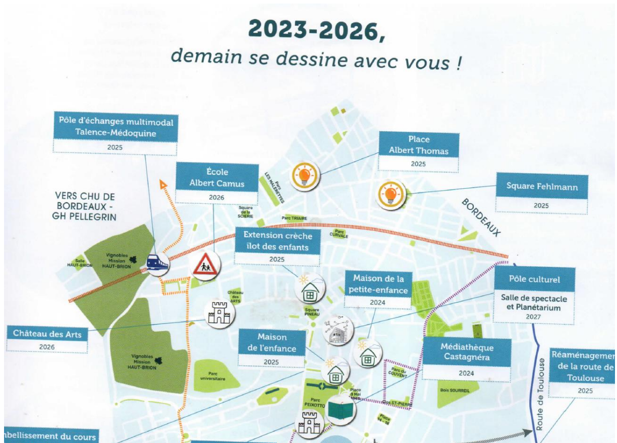
Extrait de Talence Citémag octobre 2023

Considérant qu'avec 4 000 montées et descentes journalières attendues, c'est un projet d'intérêt général pour toute l'agglomération qui est aujourd'hui au centre des préoccupations. Au-delà de la seule desserte d'un bassin de population important, c'est toute une dimension multimodale qui est également mise en avant, contribuant à favoriser un fort report modal pour les déplacements du quotidien. Soucieuse du cadre de vie des riverains, la ville s'engage dans ce projet avec la volonté de l'intégrer dans son environnement de façon harmonieuse : intégration au tissu environnant, aménagements paysagers, protections contre le bruit et limitations des nuisances sonores pour les riverains.