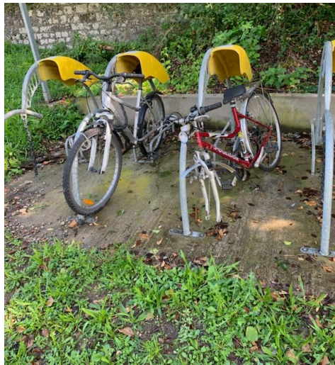
Ex : Photo parking vélo de Vayres prise lors de la visite préparatoire